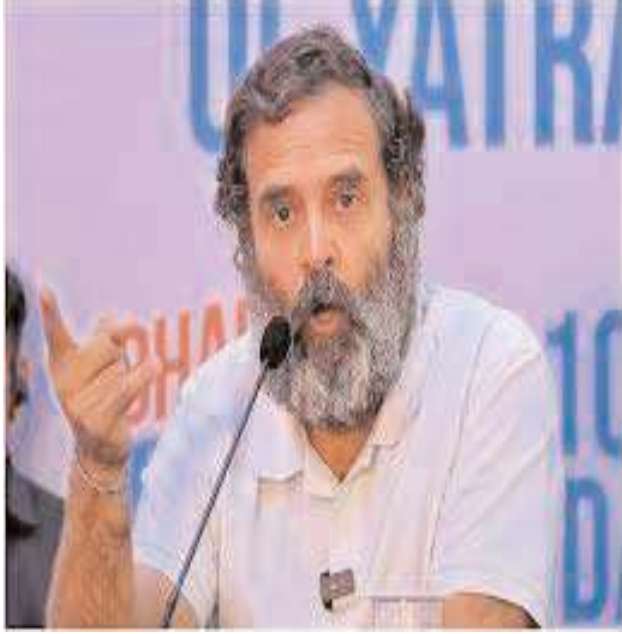
ने यूक्रेन के साथ अपनाया है क्योंकि वह (चीन) भारत की सीमाओं को बदलने की धमकी दे रहा

भारतीय जनता पार्टी (भाजपा) ने पूर्व कांग्रेस अध्यक्ष राहुल गांधी को चीन के साथ सीमा विवाद पर हाल में दिए बयान को लेकर आड़े हाथों लेकर आरोप लगाया कि वह चाहते हैं कि भारत चीन के आगे नतमस्तक हो जाए। उन्होंने कहा कि भारत जोड़ी यात्रा के दौरान भ्रमण करते-करते राहुल गांधी खुद ही भ्रम के शिकार हो चुके हैं। भाजपा प्रवक्ता सुधांशु त्रिवेदी ने राहुल गांधी पर 135 करोड़ भारतीयों का मनोबल गिराने के प्रयास का आरोप लगाकर कहा कि उनका बयान ना सिर्फ निंदनीय है बल्कि अक्षम्य भी है। ज्ञात हो कि राहुल गांधी ने पिछले दिनों अभिनेता एवं नेता कमल हासन के साथ एक संवाद के दौरान कहा था कि चीन भारत के साथ उसी सिद्धांत पर अमल कर रहा है जो रूस