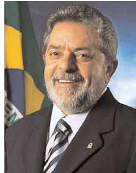
अधिकारों, संप्रभुता और विकास की इस महान इमारत को खल के वर्षों में काफ़ी नुक़सान पहुंचाया गया। इसे फिर से खड़ा करने के लिए हम हर संभव प्रयास करेंगे। लूला डा सिल्वा के

लुइज़ इनासियो लूला डा सिल्वा ने रविवार को ब्राजील के राष्ट्रपति पद की शपथ ली। लूला डा सिल्वा ने पद संभालने के बाद अपने पहले संबोधन में देश को फिर से पट्टी पर लाने पर जोर दिया और अपने पूर्ववर्ती जायर बोल्सोनारो के प्रशासन के सदस्यों को उनके कृत्यों के लिए जवाबदेह ठहराने का संकल्प लिया। लूला डा सिल्वा ने बोल्सोनारो के फिर से सत्ता में आने के सपने को तोड़ते हुए तीसरी बार राष्ट्रपति का कार्यभार संभाला है। कांग्रेस के निचले सदन में लूला डा सिल्वा ने कहा, ब्राजील के लिए हमारा संदेश आशा व पुनर्निर्माण का है।