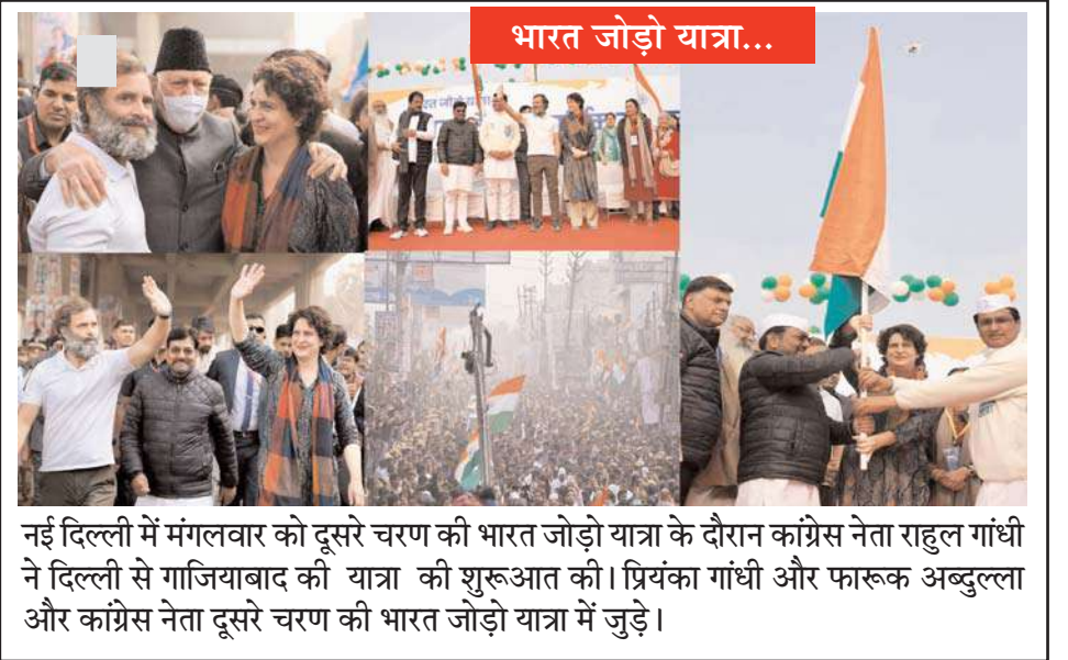
भारत जोड़ो यात्रा... नई दिल्ली में मंगलवार को दूसरे चरण की भारत जोड़ो यात्रा के दौरान कांग्रेस नेता राहुल गांधी ने दिल्ली से गाजियाबाद की यात्रा की शुरुआत की। प्रियंका गांधी और फारूक अब्दुल्ला और कांग्रेस नेता दूसरे चरण की भारत जोड़ो यात्रा में जुड़े।

को ऑफिशियल बयान जारी कर इस बारे में जानकारी दी है। अगर आप आधार कार्ड में एड्रेस अपडेट करना चाहते हैं तो आप परिवार के मुखिया का राशन कार्ड, मार्कशीट, शादी का कार्ड, पासपोर्ट जैसे डॉक्यूमेंट दिखा सकते हैं। शर्त यह है कि सॉल्यूट किए गए डॉक्यूमेंट में परिवार के मुखिया के साथ आवेदनकर्ता का रिश्ता पता चलता हो। अगर डॉक्यूमेंट में दोनों के बीच रिश्ता साफ नहीं हो रहा है तो मुखिया सेल्फ डिक्लेरेशन सॉल्यूट कर सकता है।